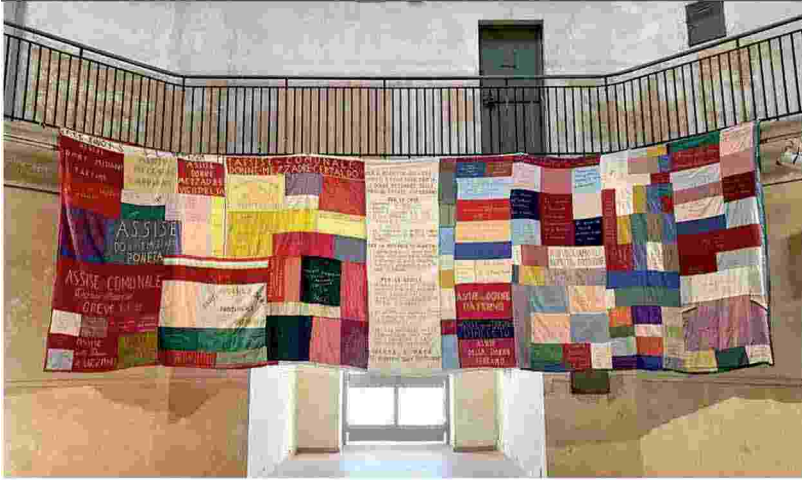
La bandiera della pace delle mezzadre (1953) esposta alle Murate